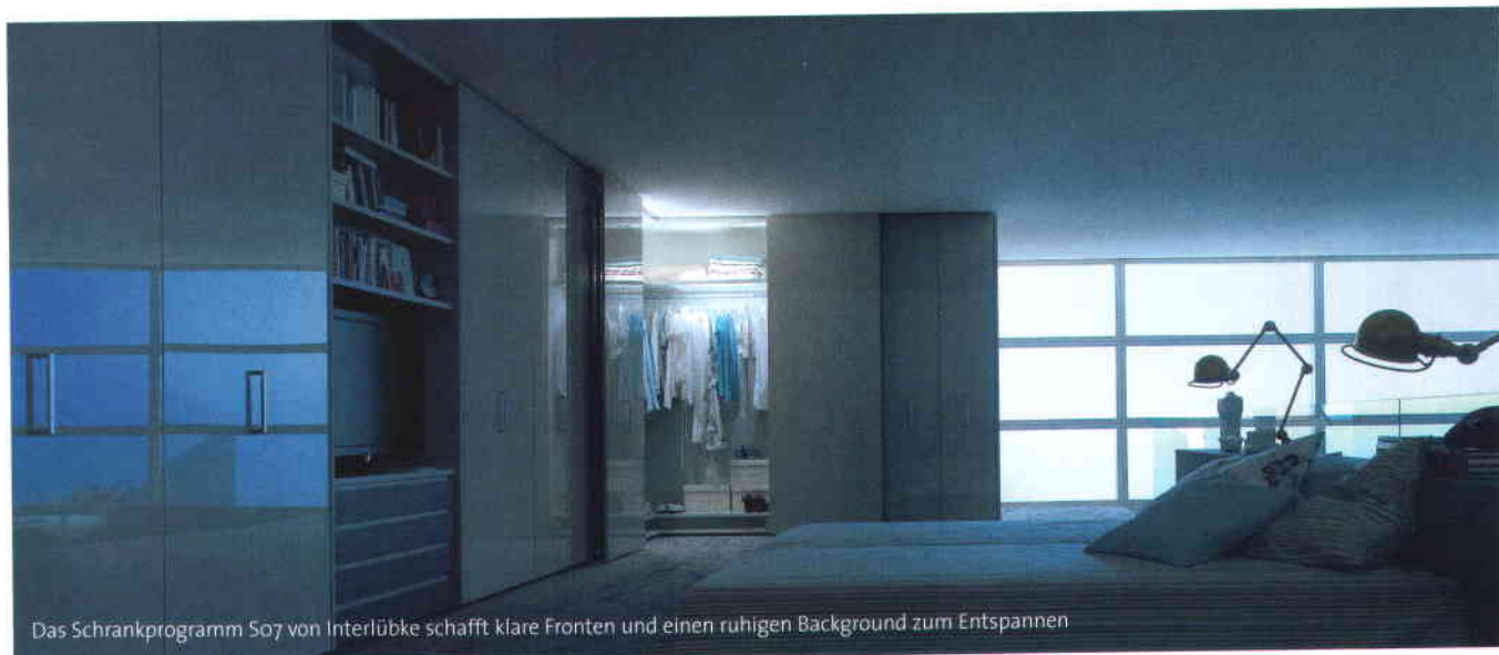
Das Schrankprogramm So7 von Interlücke schafft klare Fronten und einen ruhigen Background zum Entspannen